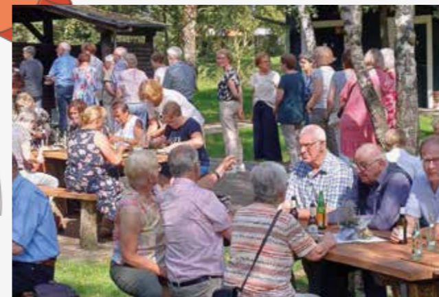
Eindrücke von unserem Ehrenamtstag am 10. September.